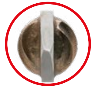
Punta de carburo de tungsteno