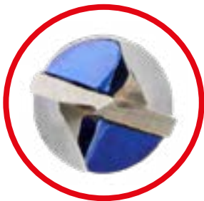
Punta de carburo de tungsteno

Las brocas para corte múltiple cuentan con una punta de carburo de tungsteno, son actualmente la mejor opción para la perforación de todo tipo de materiales cerámicos de mayor dureza.